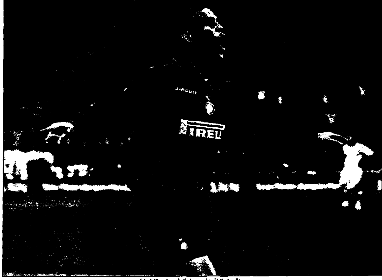
رونالدو في لحظة من إحدى مبارياته (صورة من الأرشيف)

ولد رونالدو في 22 ايلول (سبتمبر) 1976 بالقرب من مدينة ريو دي جانيرو، وكان عمه بوليسون بارله لاعب كرة قدم في نادي كلوميانتي، وهو واحد من أشهر النوادي في مدينة ريو دي ليماء، وكان والده فلاحا وفلاحا وكان شغيفا جدا في المدرسة، وكان اسداه في مسخرون من شكل اسنائه، ولولا شغفه لا كان له شأن في نخبة الناس وما وقعت في حيا صوته، اجمل حجة تكفي في البرازيل.